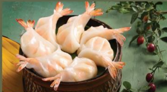
SHRIMP GYOZA Gyoza Tôm PTO