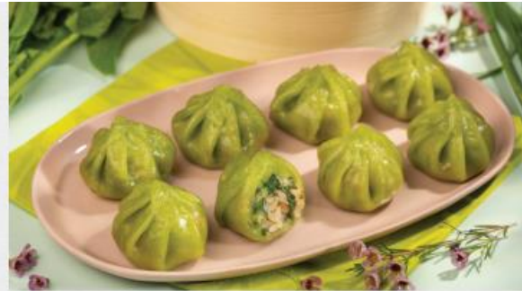
SHRIMP JADE DIMSUM Há Cảo Hẹ