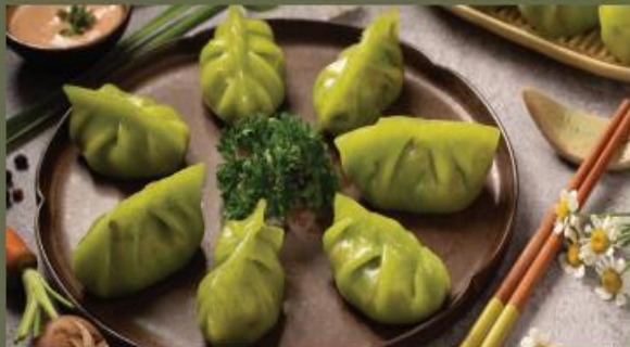
CHIVE AND VEGETABLE GYOZA Gyoza Hẹ Rau Củ