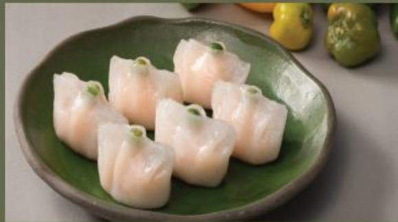
BEAN GYOZA Gyoza Đậu