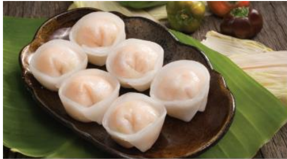
SCALLOP SHAPED HARGAO Há Cảo Sò Điệp

Dim sum là tên gọi chung của tất cả các món ăn được chế biến theo kiểu bọc một lớp bột mỏng ở bên ngoài, bên trong là nhân, bao gồm cả đồ mặn, đồ ngọt, đồ chiên hay đồ hấp. Nguyên liệu chủ yếu của món này chỉ gồm một số thành phần chính như bột gạo, bột mì, các loại hải sản và các loại rau.