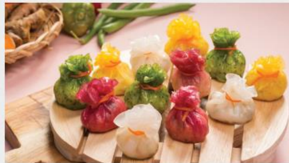
MONEY BAG HARGAO Há Cảo Túi Tiền