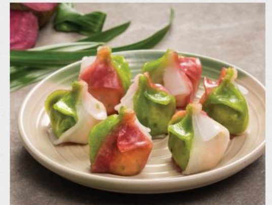
THREE COLOUR HARGAO Há Cảo Ba Màu