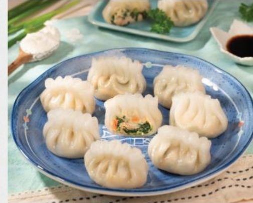
SHARK FIN DUMPLING Há Cảo Dương Thảo