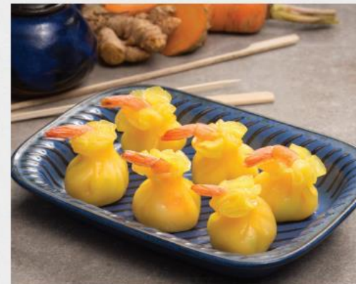
PTO SHRIMP DELI HARGAO Há Cảo Deli Tôm PTO