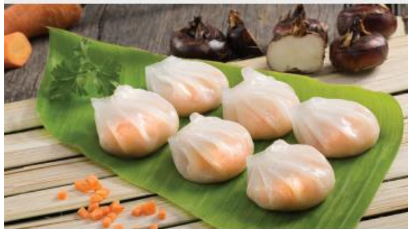
SHRIMP HARGAO Há Cảo Tôm