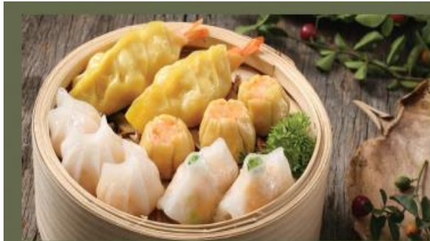
MIXED DIMSUM Combo Há Cảo Hấp

Sự tinh tế của cả hương vị lẫn sự cầu kì trong cách làm món ăn này khiến cho Dim sum là một trong những món được người người yêu thích. Cho dù vào thời điểm nào trong ngày, tại bất cứ đâu và bất kỳ cơ hội nào, chúng ta đều có thể thưởng thức món ăn này.