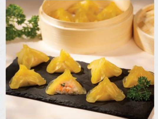
CHERRY BLOSSOM HARGAO Há Cảo Bì Đỏ